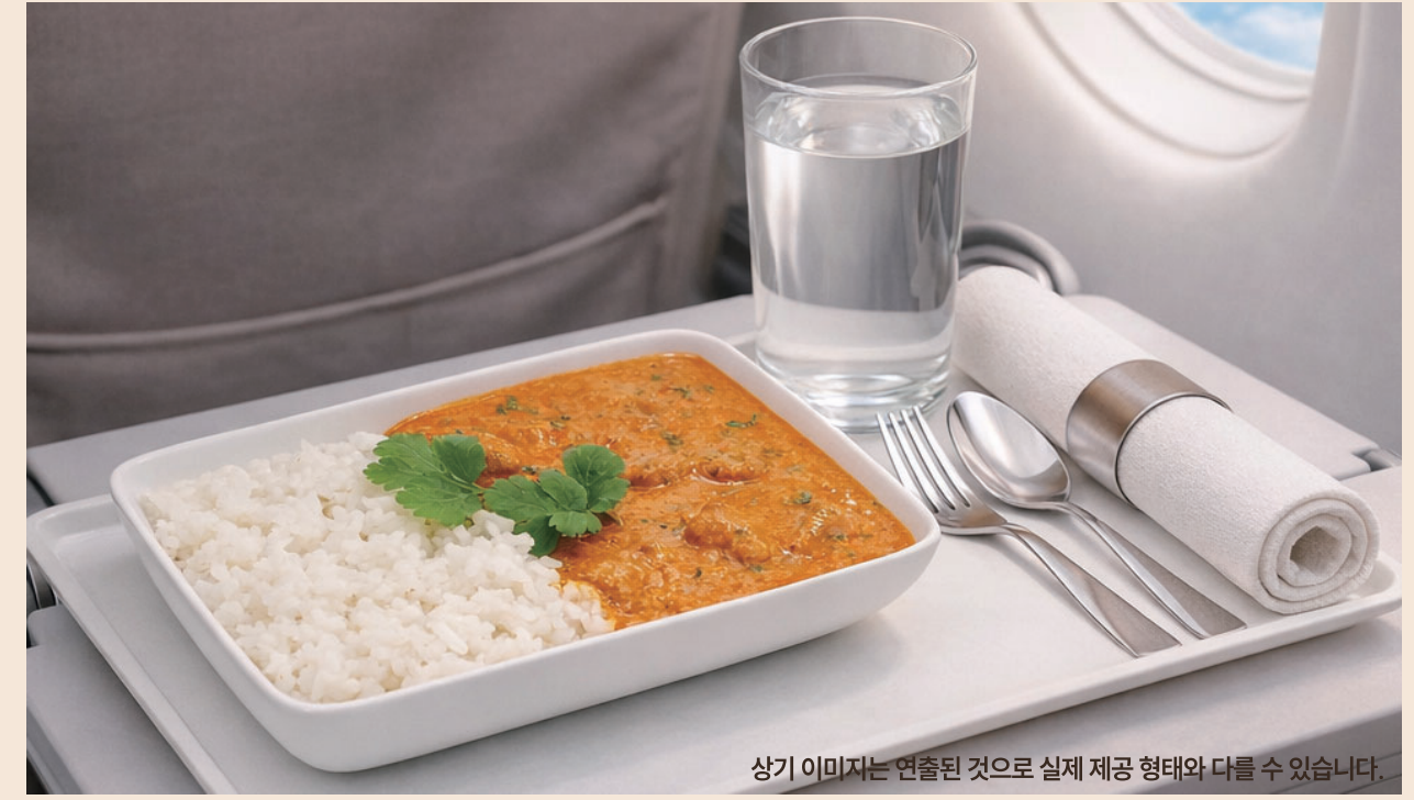
상기 이미지는 연출된 것으로 실제 제공 형태와 다를 수 있습니다.

신선한 닭다리살과 토마토, 크림으로 만든 부드러운 미식카레와 당류 ZERO, 저칼로리 미식 스키니라이스를 기내에서 바로 주문하실 수 있습니다.