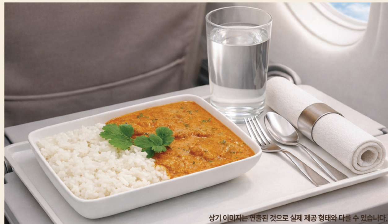
상기 이미지는 연출된 것으로 실제 제공 형태와 다를 수 있습니다.

신선한 닭다리살과 토마토, 크림으로 만든 부드러운 미식카레와 당류 ZERO, 저칼로리 미식 스키니라이스를 기내에서 바로 주문하실 수 있습니다.