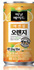
167 오렌지주스 Orange Juice 175ml ₩2,000 $2 ¥200 ¥15 €2