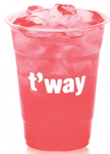
179 스웨디쉬 베리 콤부차 ZERO 제로카페인 Swedish Berries Kombucha (Caffeine-Free) ₩5,000 $5 ¥500 ¥30 €5