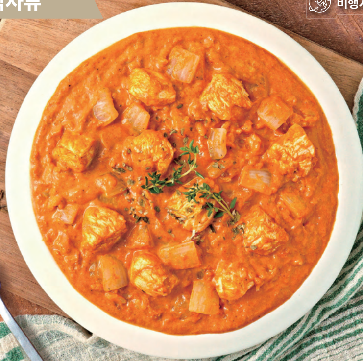
상기 이미지는 연출된 것으로 실제와 다를 수 있습니다.