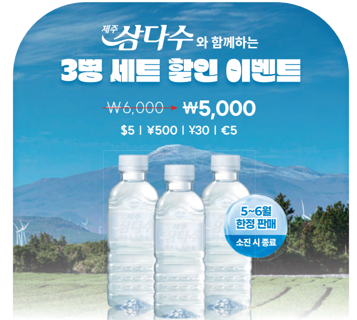
JejuSamdasoo Water 330ml (3 Bottles) 3병 동시 구매 시에만 할인 적용 (분할 구매 시 적용 불가) Valid only for purchases of 3 bottles (no split purchases)