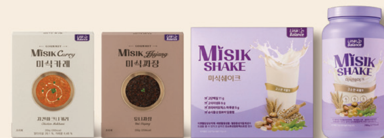
미식셰이크, 미식짜장은 기내에서 판매되는 상품이 아닙니다.