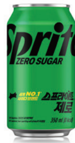
174 스프라이트 제로 Sprite Zero Sugar 350ml ₩4,000 $4 ¥400 ¥25 €4