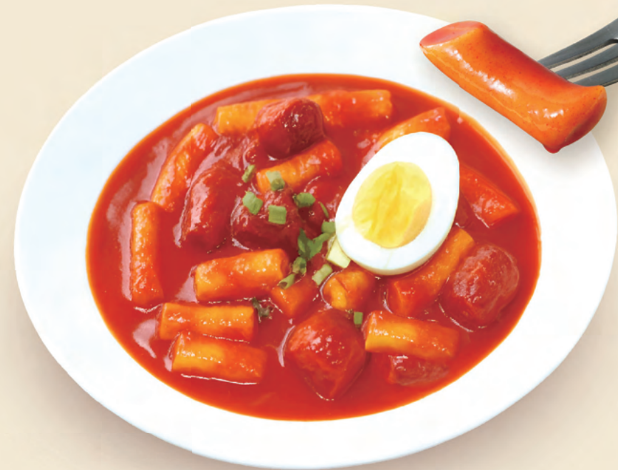
상기 이미지는 연출된 것으로 실제와 다를 수 있습니다.