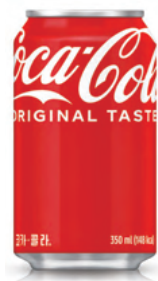
009 코카콜라 Coca-Cola 350ml ₩4,000 $4 ¥400 ¥25 €4