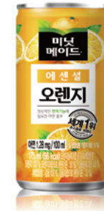
167 오렌지주스 Orange Juice 175ml ₩2,000 $2 ¥200 ¥15 €2