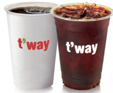
158 아메리카노 (HOT/ICED) Americano (Hot/Iced) ₩5,000 $5 ¥500 ¥30 €5