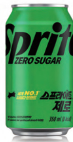
174 스프라이트 제로 Sprite Zero Sugar 350ml ₩4,000 $4 ¥400 ¥25 €4