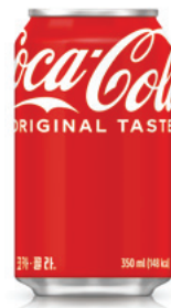
009 코카콜라 Coca-Cola 350ml ₩4,000 $4 ¥400 ¥25 €4