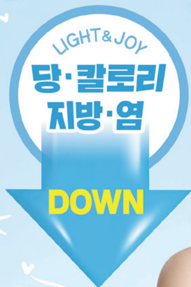
오뚜기 LIGHT&JOY 모델 김유정

LIGHT & JOY는 당, 칼로리, 지방, 염을 줄이고, 즐거움을 더한 오뚜기 라이트푸드 통합 브랜드입니다.