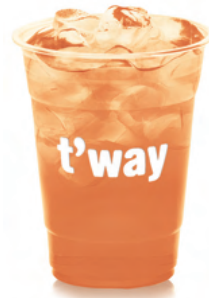
178 청포도 아이스티 ZERO 제로칼로리 Green Grape Iced Tea (Calorie-Free) ₩5,000 $5 ¥500 ¥30 €5 ※검은 입자는 홍차 추출 분말입니다.