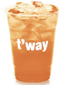
178 청포도 아이스티 ZERO 제로칼로리 Green Grape Iced Tea (Calorie-Free) ₩5,000 $5 ¥500 ¥30 €5 ※검은 입자는 홍차 추출 분말입니다.