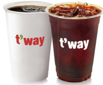
158 아메리카노 (HOT/ICED) Americano (Hot/Iced) ₩5,000 $5 ¥500 ¥30 €5